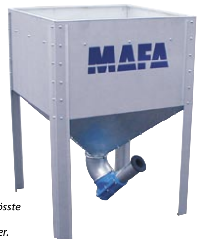
MAFA Midi ist das grösste Modell und hat ein Volumen von 730 Liter.