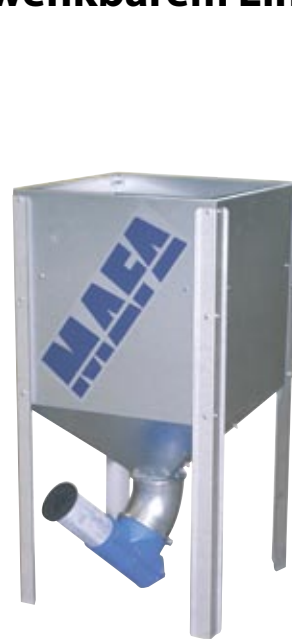
MAFA Mini nimmt 300 Liter + ev. 200 Liter = 500 Liter mit Zusatzsektion.