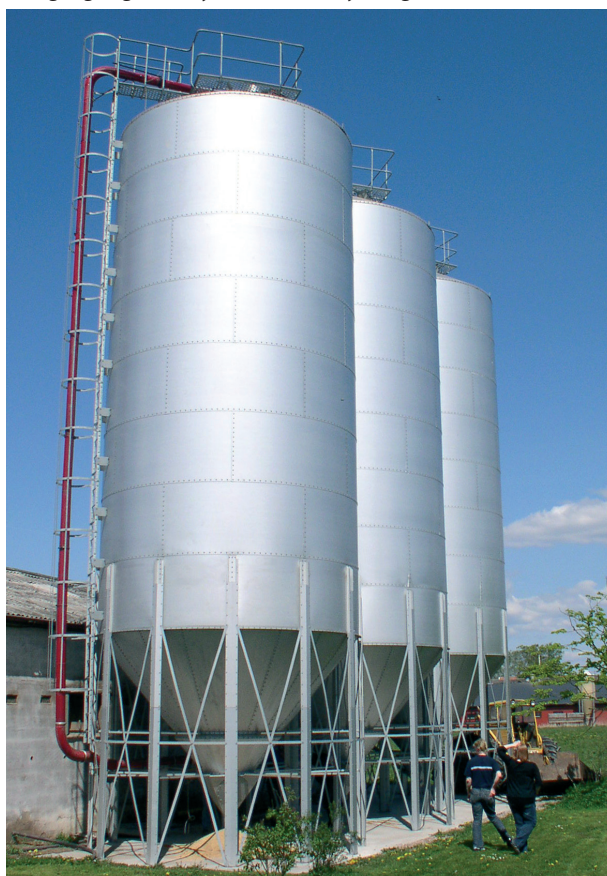
Modell XB-189 silos utrustade för fuktig lagring med rör för fyllning med högtrycksfläkt (rött rör), sidostege och takplattform.