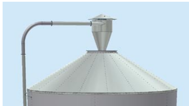
Unik XB-silo udstyret til tørlagring med indblæsningsrør og cyklon.