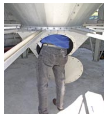
Sneglebund med mandeluge.

Yderligere info om MAFA's siloprogram findes på www.mafa.dk