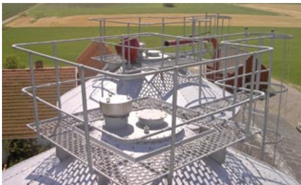
Tagplatform med rækværk samt over- og undertryksventil til fugtig lagring samt cyklon (rød) til fyldning af siloen.