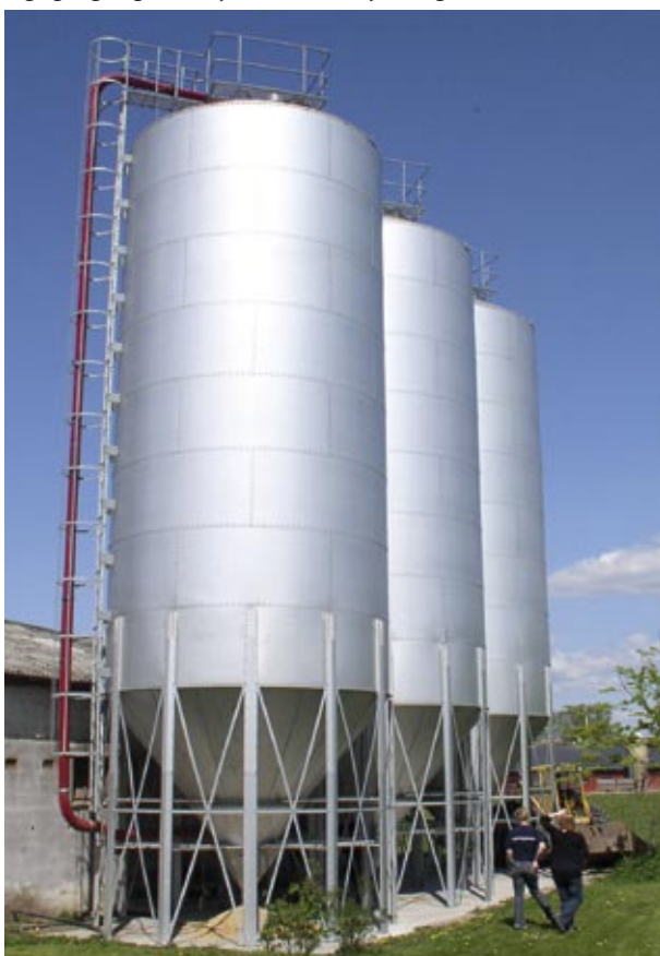
Model XB-189 silo udrustet til fugtig lagring med rør til fyldning med højtryksblæser (rødt rør), sidestige og tagplatform.