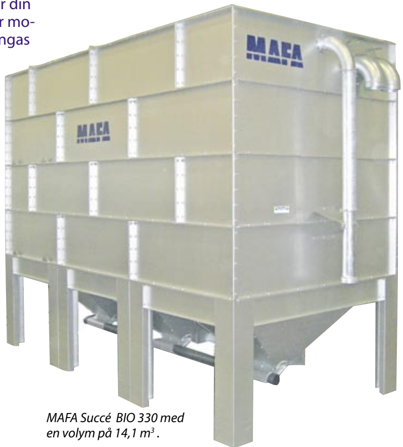
MAFA Succé BIO 330 med en volym på 14,1 m 3 .

MAFA Succé BIO är tillverkad helt i Aluzinkplåt, vilket gör att den passar även för utomhusbruk, den har droppkanter och färre bultar, vilket gör att den är enkel och smidig att montera. Silon finns i fyra längder och fem höjder, vilket svarar mot de flesta behov.