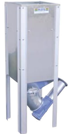
MAFA Micro er den mindste model, rummer 127 liter.