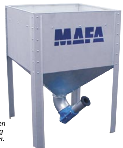
MAFA Midi er den største model og rummer 730 liter.

Kontakt din lokale installatør for yderligere information og prisberegning.