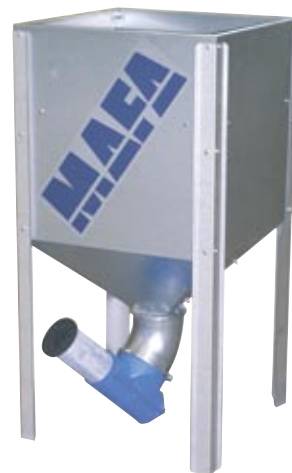
MAFA Mini nummer 300 l + evt. 200 l = 500 liter med forhøjningssektion.